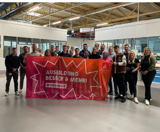
Der Ortsjugendausschuss im Mai 2023: Führung durch die Volkswagen Akademie

JUGEND Die IG Metall Jugend steht Auszubildenden und (dual) Studierenden mit Rat und Tat zur Seite