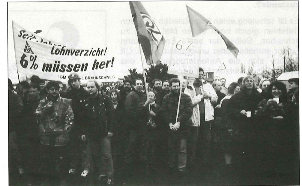
Auch IGMetaller von Siemens VT Braunschweig haben für den Tarifvertrag demonstriert

In dieser Situation war es nicht dienlich, daß der Vorstandsvorsitzende der Siemens AG, Herr Dr. von Pierer, durch seine Äußerung, er wolle auf jeden Fall aussperren, zusätzlich Oel ins Feuer gegossen hat.