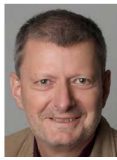
68. Henry Reeb Projektor Bahnübergangstechnik