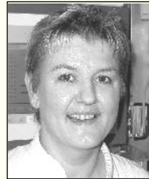
Von Heike Rosemund aus der Lenkung stammt dieses Rezept

Tortellini in Brühe abkochen und abkühlen lassen. Schinken, Tomaten, Frühlingszwiebeln klein schneiden und zu den Tortellini geben. Die Knoblauchzehen pressen und mit Salz und Pfeffer dazugeben und abschmecken. Basilikum klein hacken und auch dazu geben. Miracel Wip nach Belieben untermischen und alles gut vermengen. 1 bis 2 Stunden gut durchziehen lassen.