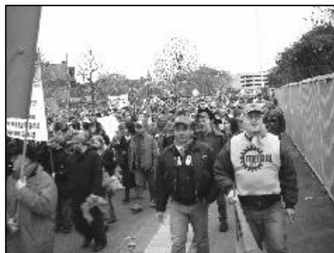
Kolleginnen und Kollegen auf der Demo am 02. Dezember

Diese Position wurde zur gleichen Zeit vom Gesamtbetriebsrat noch mal bekräftigt. Auf Drängen der IG Metall fand am 27.11.