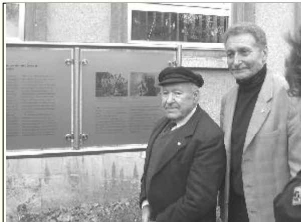
Sally Perel und Uwe Fritsch bei der Enthüllung

Das besondere an dieser Tafel ist, dass Sally Perel sie am 30.10. persönlich im Werk Braunschweig enthüllt hat. Sally ist ein sehr lebendiger Ü80er, der jetzt in Israel lebt. Aber immer wieder reist Sally nach Deutschland, um an Schulen und in Veranstaltungen insbesondere die Jugend engagiert darauf hinzuweisen, dass Rassismus und Antisemitismus keinen Platz in einer demokratischen Gesellschaft haben dürfen.