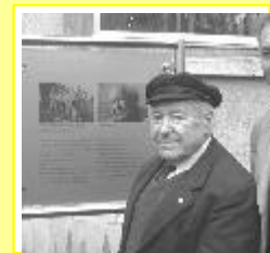
Seite 6: Eine Gedenktafel für Sally Perel