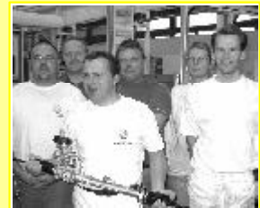
Seite 4: Die PQ-24-Lenkung