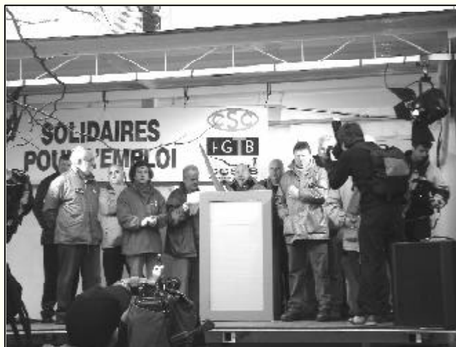
Abschlusskundgebung am 02.12.2006 in Brüssel

beteiligt waren und von rechtsradikalen Gruppierungen geschürt wurden. Auf der Abschlusskundgebung sprach für unsere Delegation der 2. Bevoll-