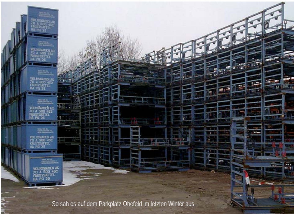
So sah es auf dem Parkplatz Ohefeld im letzten Winter aus

Das Thema Ohefeld soll auf der Sitzung im September behandelt werden. Hier wird es um ein Räumkonzept für den Winter und die zugesagte Beseitigung der Gestelle gehen.