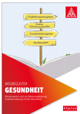
Broschüre DIN A4, Produkt-Nr. 40369-92404

Dieser Wegbegleiter bietet einen Überblick über zentrale Fragen des Arbeitslosengeldes: Wie hoch ist das Arbeitslosengeld? Wie wird es beantragt und wie lange wird es gezahlt? Was ist ein zumutbares Arbeitsangebot und was nicht? Wann treten Sperrzeiten ein?