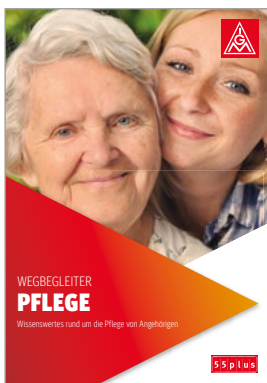
Broschüre DIN A4, Produkt-Nr. 47472-91207

Die IG Metall engagiert sich für sichere Arbeitsplätze, faire Löhne sowie eine gute soziale Absicherung. Sie unterstützt ihre Mitglieder bei Problemen in der Arbeitswelt, aber auch bei weitergehenden Fragen des Lebens. In der Wegbegleiter-Reihe werden Lebens- und Alltagsfragen wie Vorsorge, Rente, Gesundheit oder Pflege aufgegriffen. Die Themen werden übersichtlich aufgearbeitet und Orientierungshilfen gegeben.